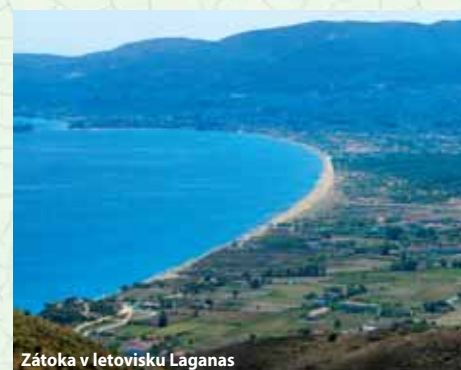
Zátoka v letovisku Laganas

Dětské slevy 1. dítě do 16 let – ubytování zdarma 2. dítě do 16 let – ubytování zdarma