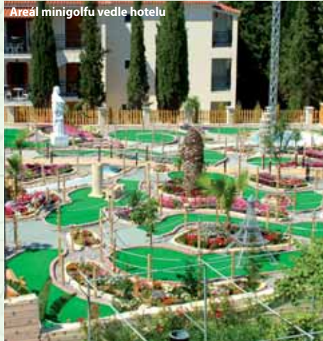
Areál minigolfu vedle hotelu

3 hlavní výhody hotelu: nádherný výhled z terasy hotelu, příjemné prostředí, pěkný dětský koutek.