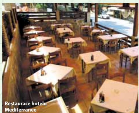
Restaurace hotelu Mediterranee

Dětské slevy 1. dítě do 16 let – ubytování zdarma 2. dítě do 16 let – ubytování zdarma